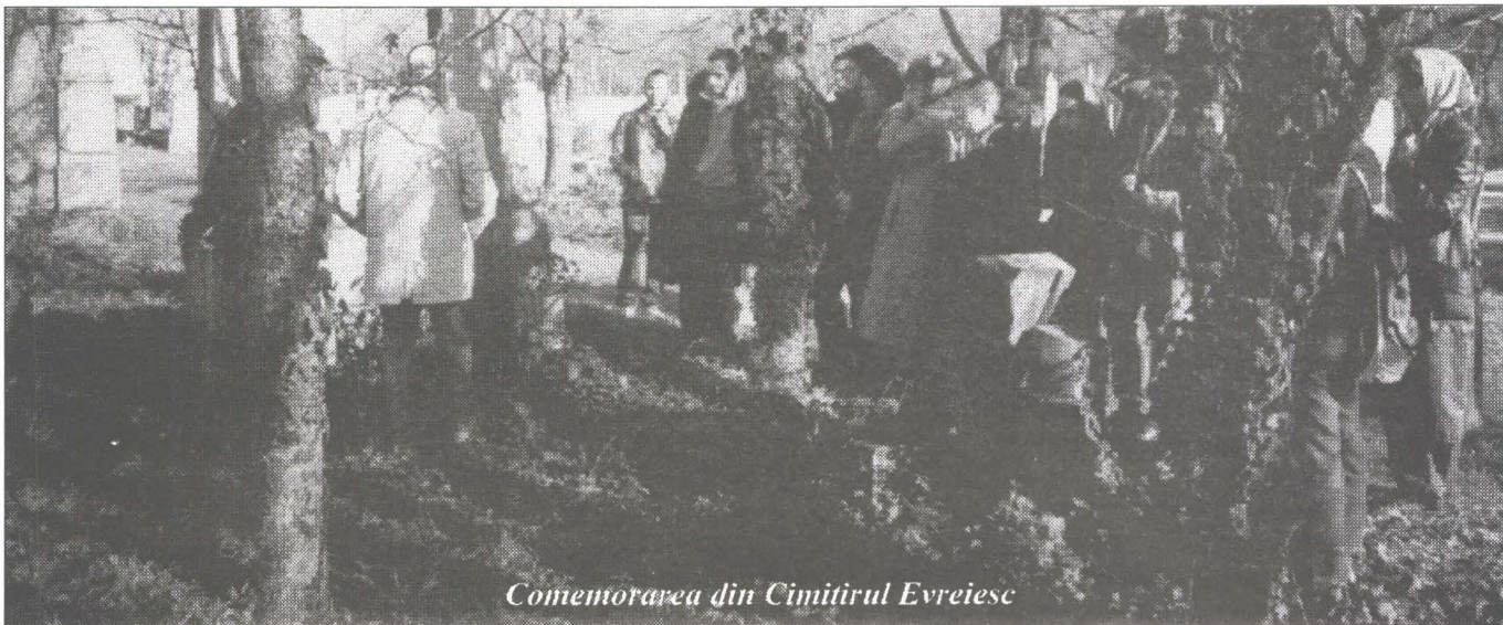
Comemorarea din Cimitirul Evreiesc