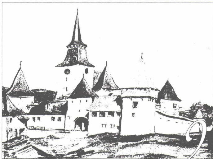
Archita • Erked • Arkeden

december 18 — A Romániai Kisebbségek Napja , a romániai kisebbségek bemutatásának szentelt információs anyag közlése a 24 ore mureșene és Népújság napilapok hasábjain.