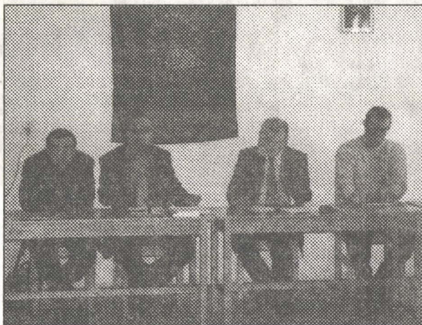
Dezbaterea „Dinamica relațiilor majoritate - minoritate în ultimul deceniu”

Pentru diseminarea principiilor și a activităților desfășurate, uniunile minorităților naționale apelează la toate sursele media atât publice cât și comerciale, naționale sau locale. În ciuda acestei deschideri și a eforturilor depuse de uniunile minorităților naționale, imaginea reflectată în ziarurile naționale este considerată incorectă de către minoritari sau chiar avînd un