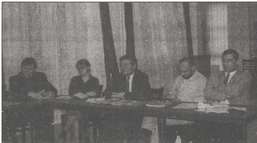
România și minoritățile — zece ani după

december 29 — Öt éves a Nefelejcs , gemyeszegi roma népművészeti fesztivál PEL és a Nefelejcs Együttes közös szervezésében.