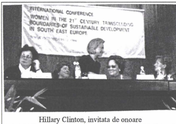
Hillary Clinton, invitata de onoare

Împărtășind principii comune în ce privește problemele consolidării democrației, securității internaționale și bazelor ei regionale, dezvoltării economice, societății civile, crimei și corupției, rolului mass mediei independente, mediului, asistenței sociale și sănătății