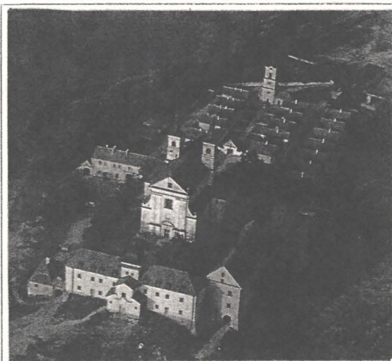
Wigry — fosta mănăstire cameduliană

Ceea ce a readus Fundația în atenția noastră este cel mai recent proiect al său, intitulat „Borderland School”, la care am fost invitați să conferențiem despre Transilvania (istorie, comunități specifice, identitate regională, interculturalitate). Școala are o durată de 1 an, studenții — în număr de șizeci — provin din Polonia, Lituania, Ucraina, Bielorusia și sînt selecționați în funcție de competența lor și implicarea în domenii legate de cercetarea multiculturalității. Cursurile sînt organizate pe trei dimensiuni: managementul organizațiilor neguvernamentale, teoria multiculturalității și stagiul practic, fiind conduse de experți vest și est-europeni. Școala este finanțată de Uniunea Europeană, în cadrul Programului PHARE. Cursul inaugural din Săptămîna 1-6 iunie 1996 a fost găzduit în splendid renovata mănăstire cameduliană de la Wigry și a permis primei serii