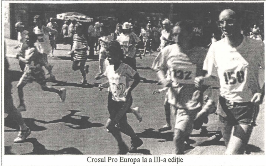
Crosul Pro Europa la a III-a ediție

Dar nu sîntem romantici, nu sîntem fanatici, și nu ne amăgim.