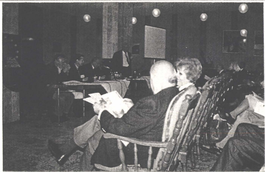
Conferința ecologică internațională „Limpezimea rîurilor comune”

Chiar dacă cuantificarea impactului social al proiectelor noastre este imposibilă, putem, credem noi, conchide, că dacă fiecare participant al celor cinci manifestări atît de diferite ca profil, nivel sau arie de răspîndire, va putea deveni un multiplicator al ideilor europene pentru cel puțin alte două persoane, ciclul de manifestări desfășurate sub genericul ZILELE EUROPA NAPOK și-a atins pe deplin scopul. Avem convingerea că într-o bună zi raportul de răspîndire va crește chiar în progresie geometrică. Atunci, propagandiștii de astăzi ai autohtonismului conservator vor fi probabil cei mai înflăcărați susținători ai acestor idei. Așteptăm cu răbdare ziua. (S.Z.E.)