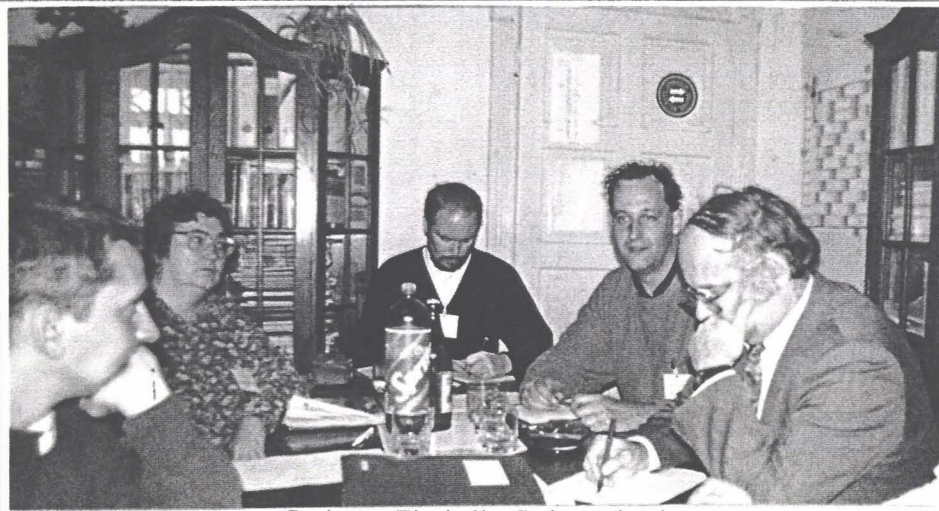
Sesiunea Ziaristilor Independenți

Întîlnirea de la Tîrgu Mureș a prilejuit un schimb benefic de idei, sincronizarea activi-