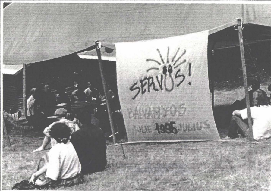
Un salut atotcuprinzător...

zgomotul asurzitor al muzicii rock, la taclale, amestecînd cuvintele și descoperindu-și gusturi comune, au neutralizat stereotipii și s-au pregătit psihologic pentru a-lîntzege și respecta pe celălalt. În paralel, în holul Hotelului Carpați, se desfășurau înfîlnirile informale dintre intelectuali, politicieni și lideri de opinie din cele două țări, animați de bună-voință, dar și temeri sau suspi-