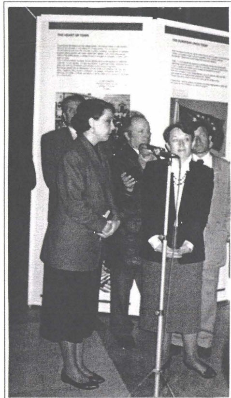
Karen Fogg, ambasadoarea Uniunii Europene, vernisînd expoziția Piețele Orașelor Europene

numele, a rostit celebra frază: "Europa nu se va face printr-o lovitură, nici printr-o construcție de ansamblu: ea se va face prin realizări concrete creînd mai întîi o solidaritate de fapt". În numele acestei "solidarități de fapt" care a transformat Europa războaielor în Europa bunăstării - aniversînd totodată și cincizeci de ani de la sfîrșitul războiului mondial -, a organizat și