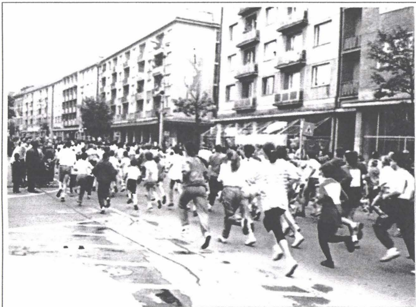
Crosul PRO EUROPA

Datorăm mulțumiri pentru sprijinul material acordat organizării acestui “festival” al spiritului european Fundației Heinrich Böll din Germania și Uniunii Europene exprimîndu-ne speranța ca în viitor această serie de manifestări să poată chiar deveni un Festival al Europeanismului ca o permanență, cu reale șanse de ne apropia de sistemul de valori a căror însușire ne-am fixat-o drept scop. (E.Sz.)