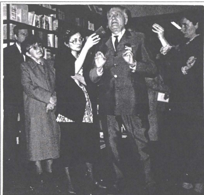
Adrian Marino - cu ocazia lansării cărții: Pentru Europa la librăria Romulus Guga