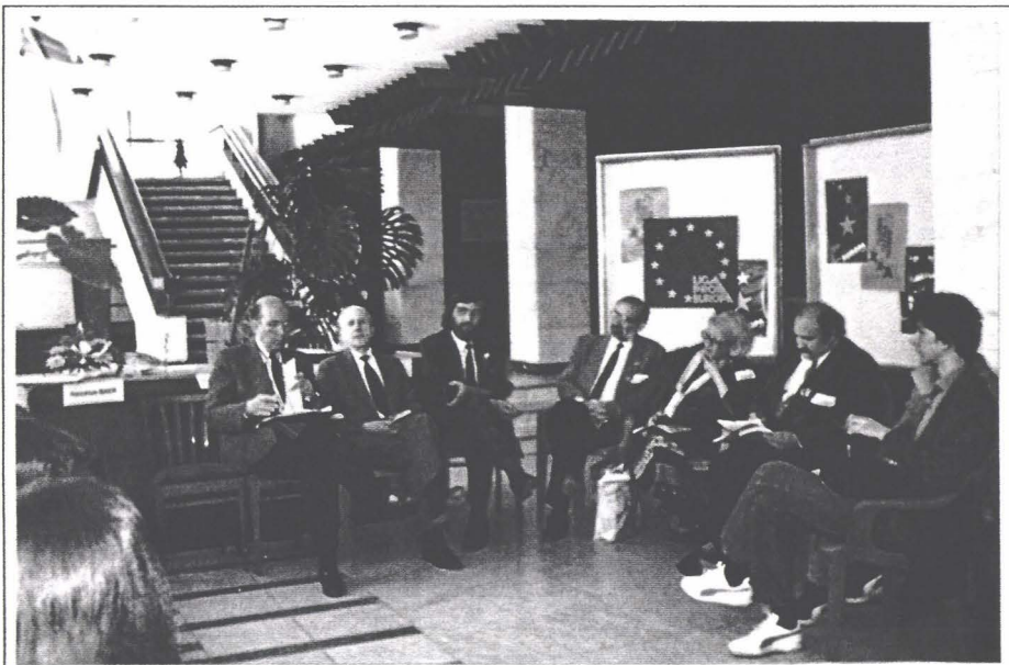
Seminarul NED - Sfintu Gheorghe

antevorbitori privind insuficiența sau imperfecțiunea instituțiilor de stat în rezolvarea problemelor de natură educațională, dl. Csörtán arăta că legitimitatea demersului social se face prin proceduri democratice, prima și cea mai importantă fiind votul. Imperfecțiunea demersului nostru, adică a votului, cauzează im-