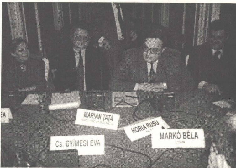
Masă rotundă: „Triunghiularul Toleranței”

Săptămîna a fost clădită atît pe evenimente culturale cît și pe dezbateri, elementul comun, liantul propriu-zis, fiind DIALOGUL.