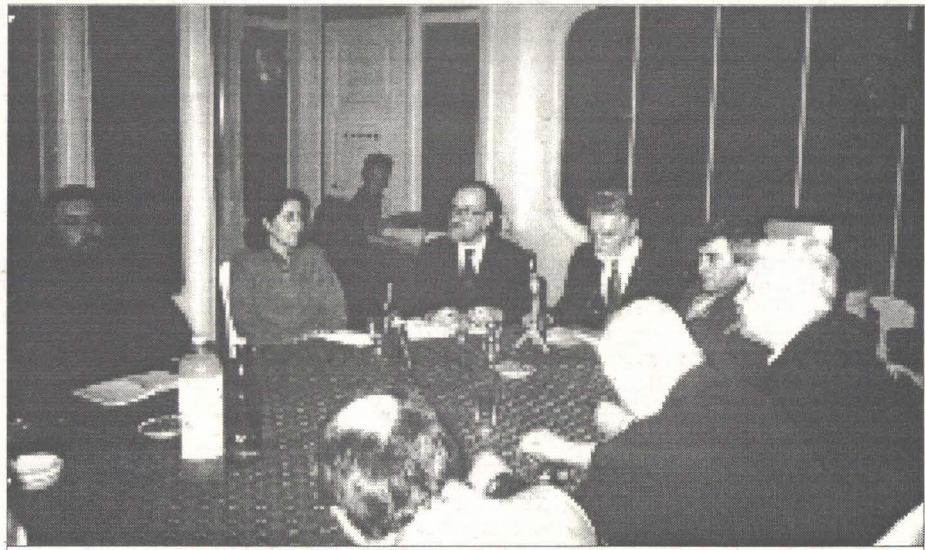
Masă rotundă: „Credință și toleranță“

Sîmbătă dimineața o altă masă rotundă: „Platforma prieteniei după 5 ani” , o temerară încercare de reuni grupul celor 30 de semnatori ai Platformei Prieteniei din 26 decembrie 1989 , intelectuali români și maghiari, și de a le pune astăzi întrebarea: ce