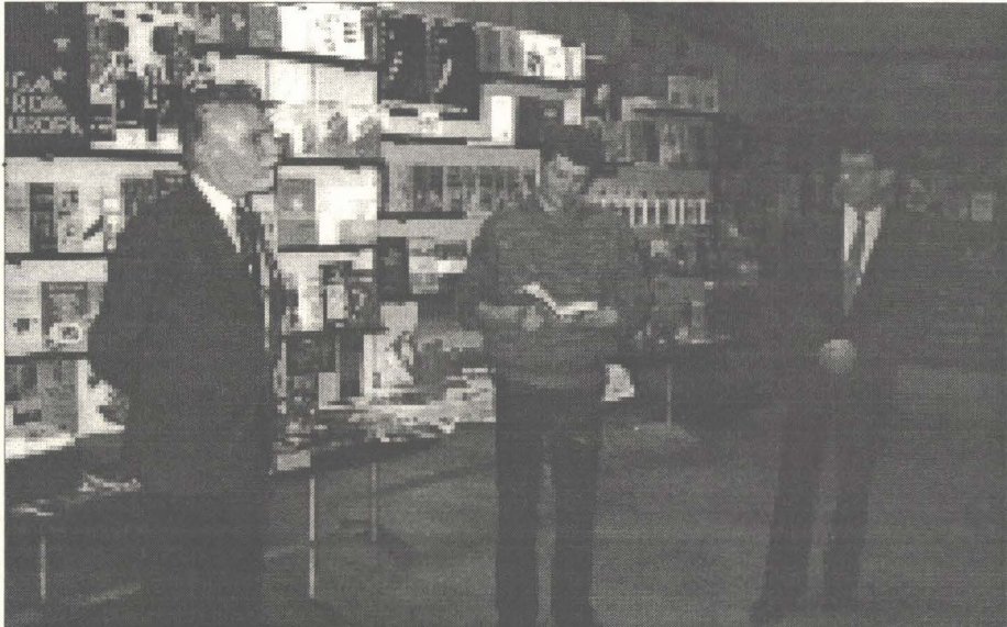
Expoziția de carte a editurii Kriterion - librăria „Mihai Eminescu“