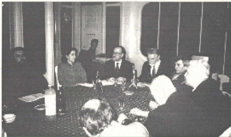
Masă rotundă: „Credință și toleranță”

Dacă această Săptămîna de martie, acest eveniment cultural-civic înfăptuit de către Centrul Inter-cultural grație generozității Fundației Heinrich Böll din Germa-