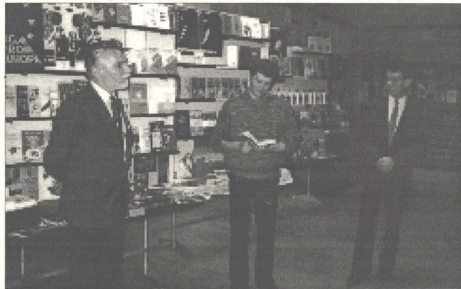
Expoziția de carte a editurii Kriterion - librăria „Mihai Eminescu”