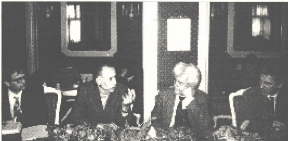
Masă rotundă: „Platforma Prieteniei la 5 ani“